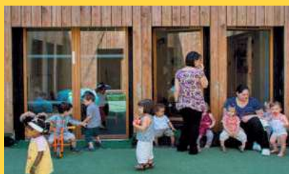
La Crèche à la Friche.